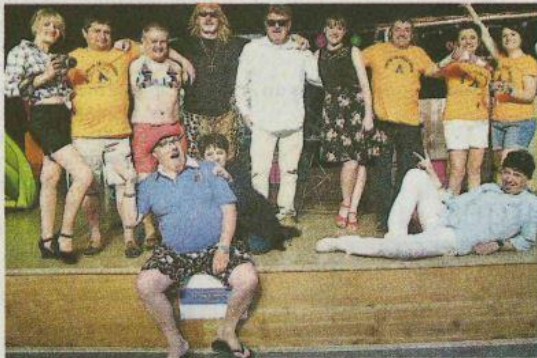
Les Zérokinis vont animer la fête des 25 ans du club de théâtre de la MJC.

L'histoire : « C'est la fin de l'été au camping La Crique rieuse. La directrice Eglantine et son staff font le bilan de la saison et celui-ci est bien morose. Les comptes sont dans le rouge et le petit camping familial a du mal à vivre face aux grandes structures hôtelières. D'autant plus qu'apparemment les vautours commencent à tourner au-dessus de la proie. Mais les derniers campeurs encore présents et les employés hauts en couleurs ne veulent pas abandonner. La lutte entre le pot de terre et le pot de fer semble bien inégale.